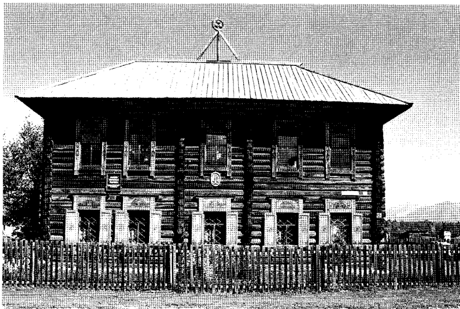
Дом-музей Н.К. и Е.И. Рерихов в с. Верхний Уймон.

Еще в 1974 году на “доме Атаманова” в селе Верхний Уймон Усть-Коксинского района Горно-Алтайской АО была открыта мемориальная доска с барельефом Н.К. Рериха в честь пребывания его экспедиции на Алтае. Набирала обороты просветительская программа гуманитарного направления. Научно-исследовательская же программа по Агни-Йоге, куда входили проблемы “состояния Природы” и “приближения Эпохи Огня”, явно (и скрытно) начала уходить на второй план, в “далекое будущее”.