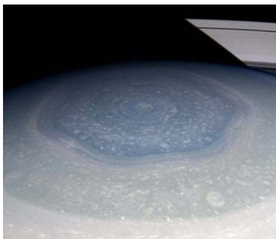
Шестиугольное устойчивое атмосферное образование на северном полюсе Сатурна, открытое аппаратом «Вояджер-1» и снова зафиксированное в 2006 году аппаратом «Кассини-Гюйгенс»

Это, конечно трудно воспринимать, но тем не менее, это так. Я хочу показать, какая внешняя среда, в которой мы хотим построить себе коттедж или купить «Порше». Может как-то в одночасье всё это потерять очень сильно жизненное значение. Теперь, если мы начнём двигаться сюда, ближе к Солнцу, там у нас – Сатурн. Наверное, вы смотрели по Интернету, что у Сатурна, и в южном полушарии, и в северном полушарии гексометрия появилась, появились шестиугольники большие, которые на огромную глубину в атмосферу Сатурна идут.